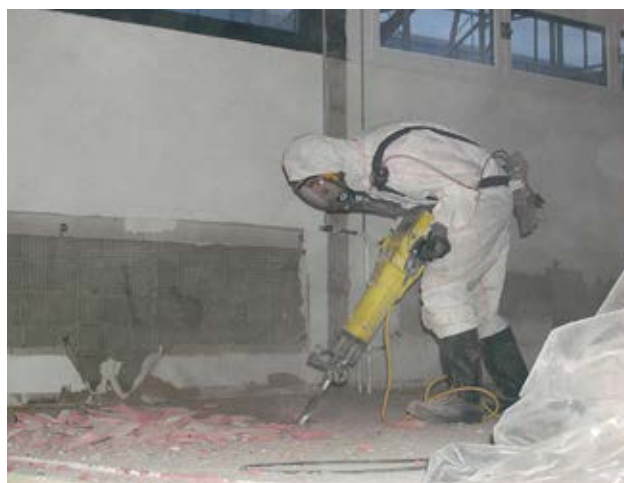
2 Ein Bodenbelag wird mit einem Spitzhammer entfernt.