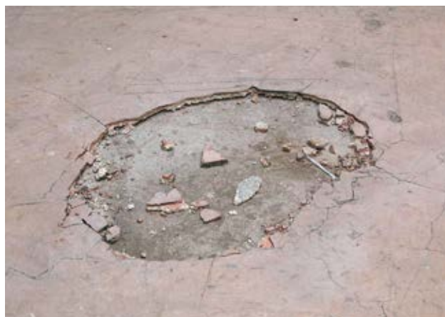
1 Steinholz-Bodenbelag – asbesthaltiger Magnesia-Estrich

Besteht der Verdacht, dass beim Bearbeiten oder Entfernen von Steinholz-bodenbelägen Asbest auftreten kann, so sind die Gefährdungen vor Beginn der Arbeiten genau zu ermitteln.